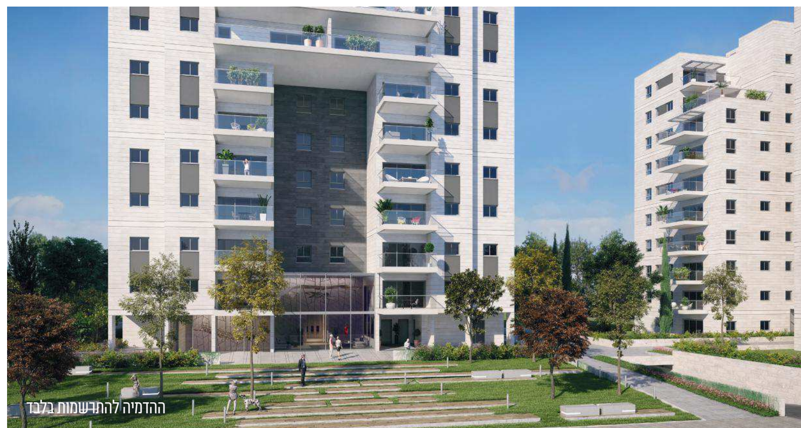
ההדמיה להתדמיות בלבד