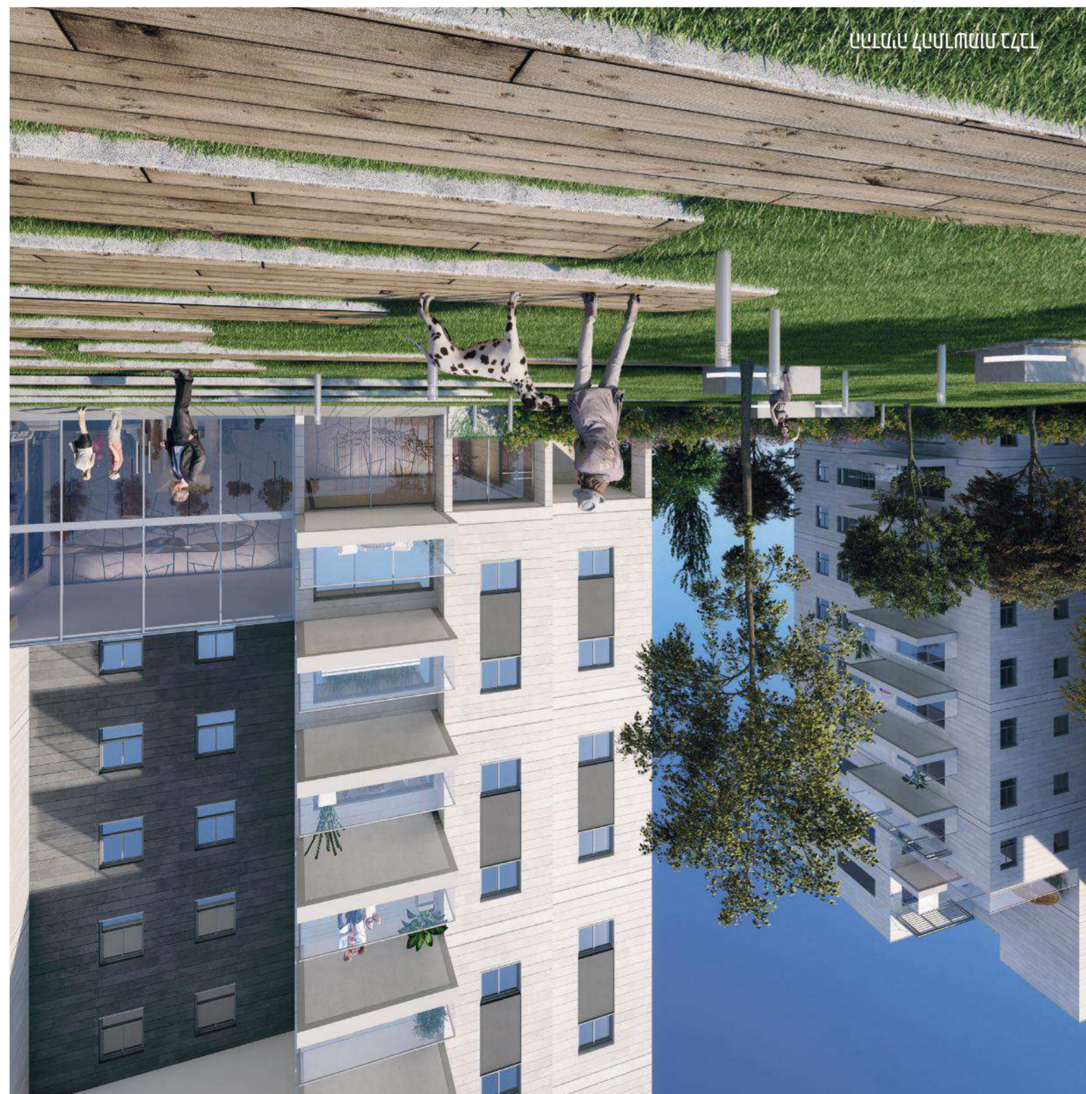
הדומיה להתח שמות בלבד

GP GRAND PENTHOUSE רוחם שני בדנדייס רעננה