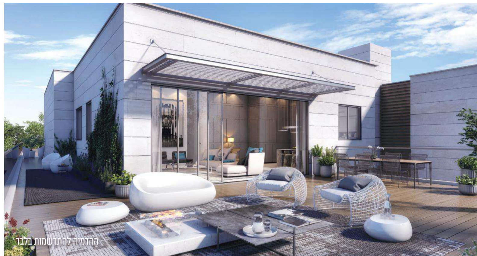
הדומיה להתח שמות בלבד