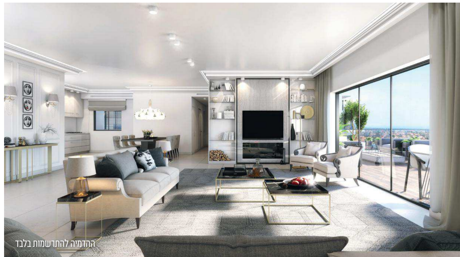
הדומיה להתח שמות בלבד